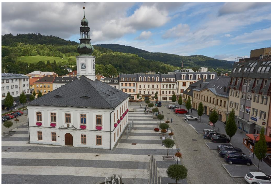
obrázek 1 - Masarykovo náměstí, radnice