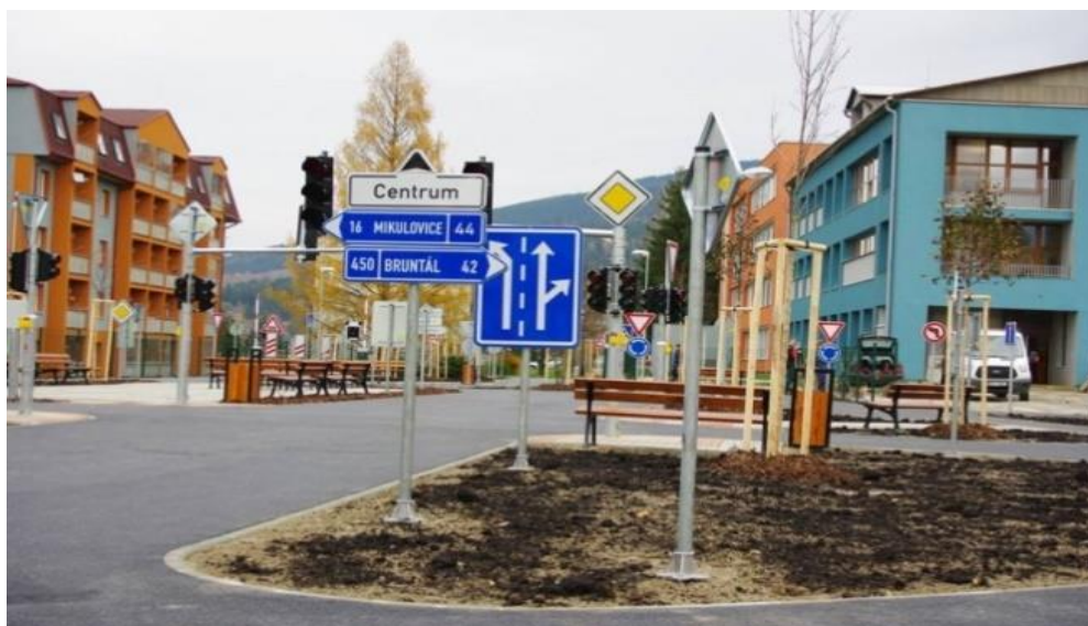
obrázek 2 – Dětské dopravní hřiště Jeseník, foto: MěÚ Jeseník

Plán udržitelné městské mobility – zvýšení kvality života ve městě, snížení ekologické zátěže a posílení bezpečnosti v dopravě.