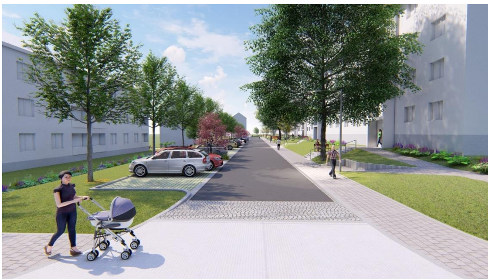
obrázek 3 - Revitalizace sídliště 9.května - IV. etapa, vizualizace

Město chce pro své občany vybudovat 50 družstevních bytů.